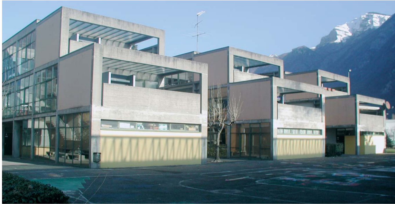
Fra le priorità della prossima legislatura il risanamento strutturale e termico delle scuole comunali

L'obiettivo elettorale del PLR è chiaro: tornare ad avere 2 rappresentanti in Municipio e aumentare possibilmente il numero dei consiglieri comunali, che sono attualmente 6. Un Municipio più equilibrato permetterà di superare le difficoltà politiche vissute in questa legislatura e culminate con la spaccatura in seno al PPD. Molti progetti sono fermi a causa di questa situazione. Gli obiettivi politici più importanti della prossima legislatura li potete leggere qui di seguito. Sono gli obiettivi che i rappresentanti del PLR si impegnano a sostenere. Restiamo naturalmente a disposizione della popolazione per approfondire anche altri temi e progetti.