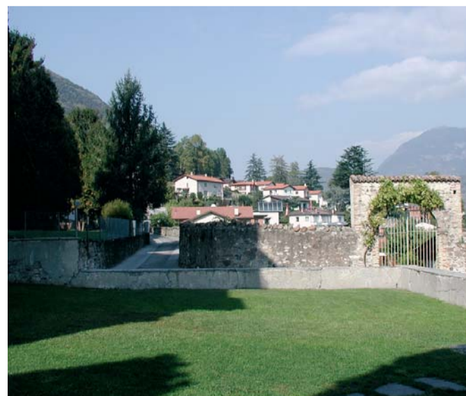
Valorizzare la vocazione residenziale e turistica di Riva

Aprire subito la discussione con la popolazione di Riva San Vitale, che deve ottenere tutte le informazioni necessarie per maturare una propria convinzione. La votazione sull'eventuale aggregazione deve avere luogo nel 2011. Il Municipio però nel frattempo non deve ipotizzare solo l'aggregazione con Mendrisio, bensì approfondire seriamente ogni opzione alternativa, compresa la collaborazione con gli altri Comuni a livello di servizi. Diciamo "no" all'aumento del debito pubblico comunale, per non costringere Riva San Vitale a doversi aggregare per forza.